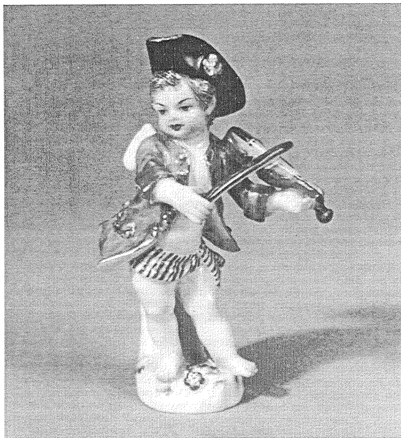
Abbildung: Michel Victor Acier, Figur "Geiger" aus der Serie "Verkleidete Amouretten" (klein), Staatliche Porzellanmanufaktur Meißen, Formnummer neu: 60110 (alt: 16). 38

Petersburger Ermitage-Museums aufbewahrt. 37 Ferner besitzt das Ermitage eine Komposition von 1774, die den Feldmarschall P. A. Rumjancev-Zadunajskij und seinen Sieg über die Türken verherrlicht.